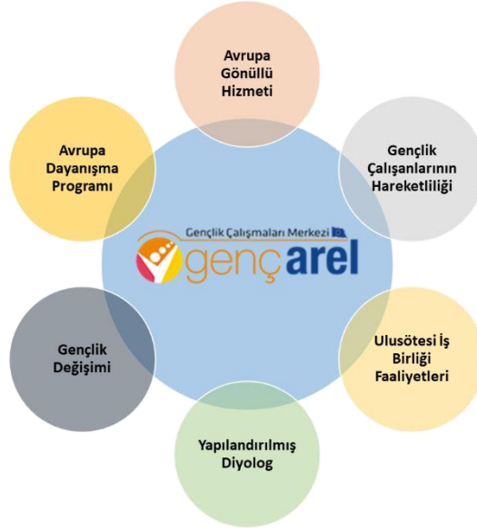
Şekil 2. GençAREL Faaliyet Alanları

2022-2023 akademik yılında Yapılandırılmış Diyalog faaliyeti kapsamında GENÇAREL tarafından bir faaliyet gerçekleştirilmemiştir.