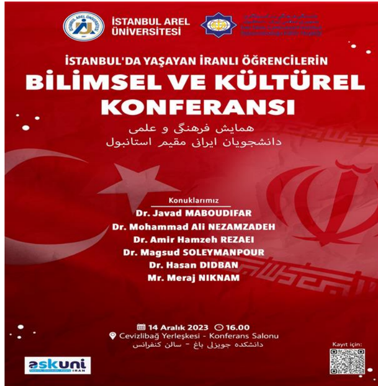
Şekil 2. İstanbul'da Yaşayan İranlı Öğrencilerin Bilimsel ve Kültürel Konferansı afişi